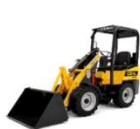
Gehl AL140 875 kg (*)

Er is de keuze uit vijf modellen met een operationeel gewicht van 1.744 tot 4.953 kg en een hefhoogte (scharnieras bak) van 2,7 tot 3,45 meter.