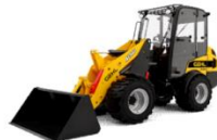
Gehl AL540 1993 / 2288 kg (*)